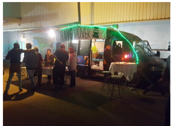
Hangover Café – CEID Addictions

La mobilisation de personnes en service civique, eux-mêmes étudiants ou jeunes professionnels, permet d'intervenir auprès d'un public jeune à travers une approche par les pairs 6 . En effet, le responsable du Hangover Café a pu constater que l'intervention auprès du jeune public bordelais d'intervenants plus âgés peut produire un décalage qui rend le public moins à l'écoute des différents messages.